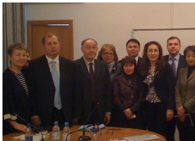
На фото: Проф. А.В.Новиков и коллектив КУЭФиМТ

В апреле 201г. делегация СБА НОВА посетила Казахский университет экономики, финансов и международной торговли (КУЭФиМТ) в городе Астана (Республика Казахстан).