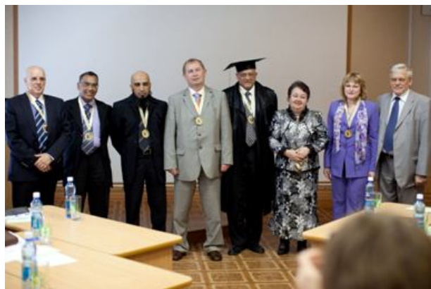
На фото: участники конференции в САФБД